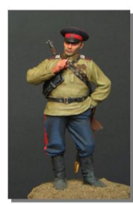
Военная форма Донских казаков

- Перед вами мужская казачья одежда очень долго. Шло частью приказу